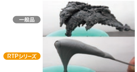
常温保管6ヶ月後の増粘度比較